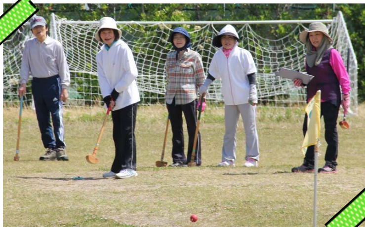
午前の競技 グラウンドゴルフ