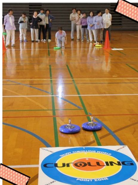
午後の競技 カローリング